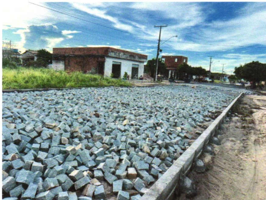
Foto 12 - ASSENTAMENTO DE GUIA (MEIO-FIO) EM TRECHO RETO, CONFECCIONADA EM CONCRETO PRÉ-FABRICADO, DIMENSÕES 100X15X13X30 CM (COMPRIMENTO X BASE INFERIOR X BASE SUPERIOR X ALTURA), PARA VIAS URBANAS (USO VIÁRIO). AF_06/2016