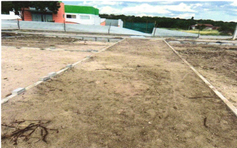
Foto 02 - REGULARIZAÇÃO E COMPACTAÇÃO DE SUBLEITO DE SOLO PREDOMINANTEMENTE ARENOSO. AF_11/2019