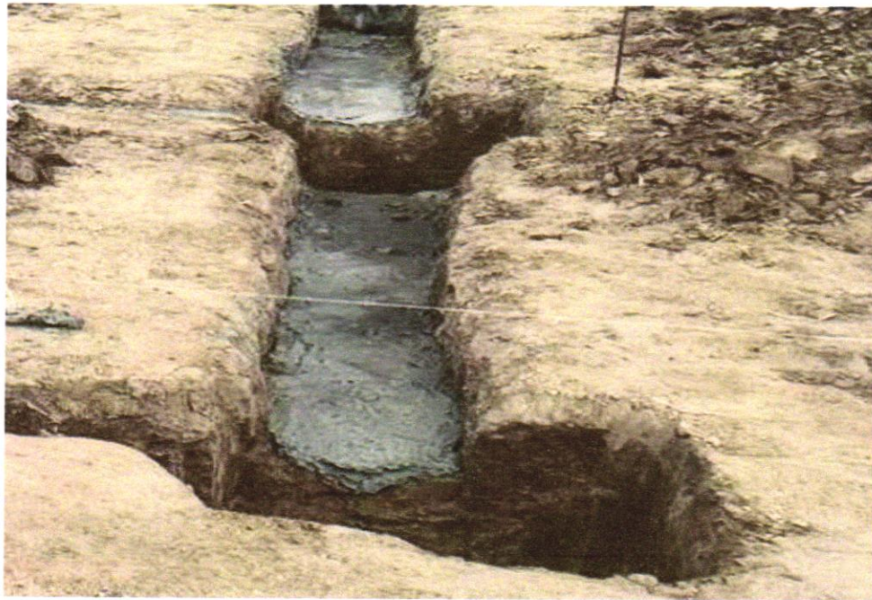
Foto 06 - COMPOSIÇÃO REPRESENTATIVA) EXECUÇÃO DE ESTRUTURAS DE CONCRETO ARMADO, PARA EDIFICAÇÃO HABITACIONAL UNIFAMILIAR TÉRREA (CASA EM EMPREENDIMENTOS), FCK = 25 MPA. AF_01/2017