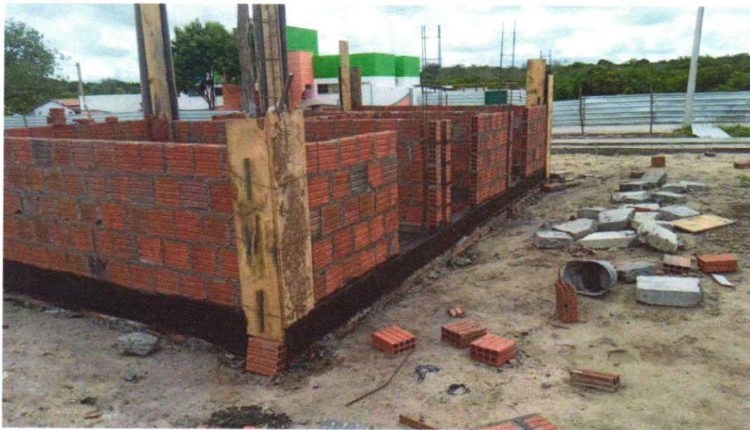
Foto 10 - CONTRAPISO EM ARGAMASSA TRAÇO 1:4 (CIMENTO E AREIA), PREPARO MANUAL, APLICADO EM ÁREAS MOLHADAS SOBRE IMPERMEABILIZAÇÃO, ACABAMENTO NÃO REFORÇADO, ESPESSURA 4CM. AF_07/2021