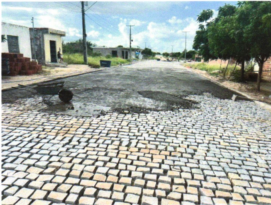
Foto 14 - ASSENTAMENTO DE GUIA (MEIO-FIO) EM TRECHO RETO, CONFECCIONADA EM CONCRETO PRÉ-FABRICADO, DIMENSÕES 100X15X13X30 CM (COMPRIMENTO X BASE INFERIOR X BASE SUPERIOR X ALTURA), PARA VIAS URBANAS (USO VIÁRIO). AF_06/2016